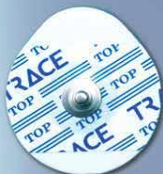
NM 42 DFI