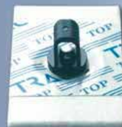
NM 2844 FBI

30 pz/busta- 600 pz/scatola - 7.200 pz/cartone