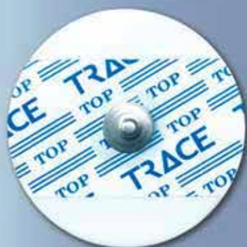
NM 50 RFI