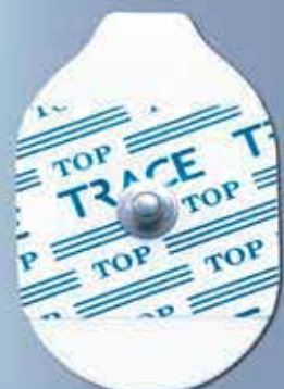
NM 3351 OFI