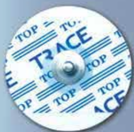
NP 30 RFI