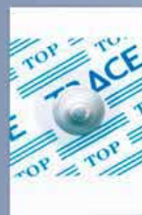
NM 2844 RFS

Il modello più richiesto per uso pediatrico. Qualità eccellente e garantita anche in pazienti "critici".