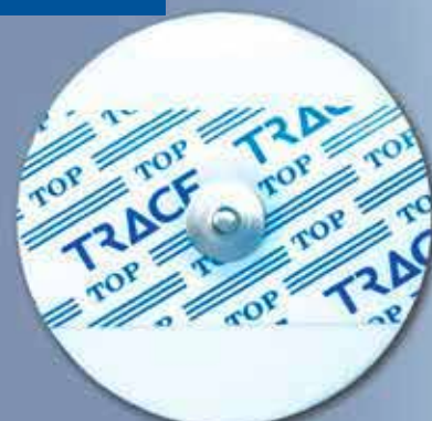
NM 55 RLI

Le misure più classiche. I supporti più richiesti. Una qualità comprovata.