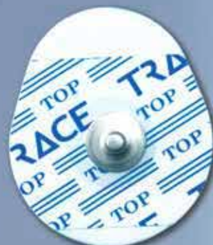
NM 3642 OFI

Due modelli polifunzionali: utilizzabili per adulti e per uso pediatrico.